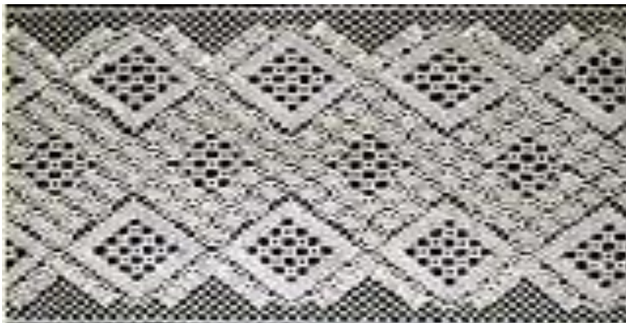
Мценское кружево. Прошва, сиреневый шёлк, вискоза. Автор – Юлия Ковалёва

Мценское кружево одно из самых старинных на Руси. Елецкое, к примеру, возникло гораздо позже, хотя Елец — тоже город древний и от Мценска совсем недалеко.