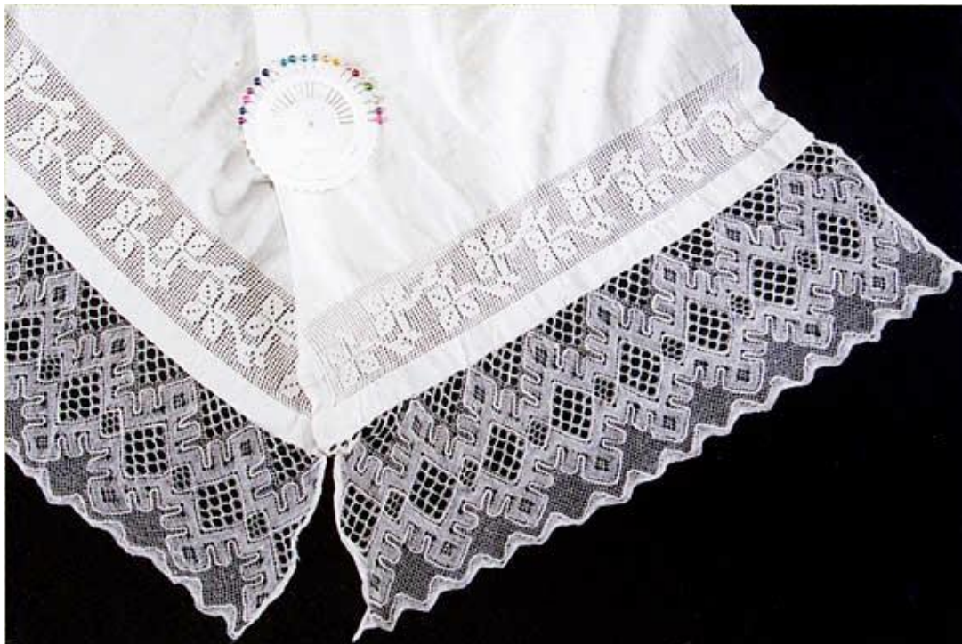
Полотенце. Мценское кружево. Лён, XIX век.

Оказывается, еще в XVIII веке помещица Протасова открыла под Мценском мануфактуру по производству кружева.